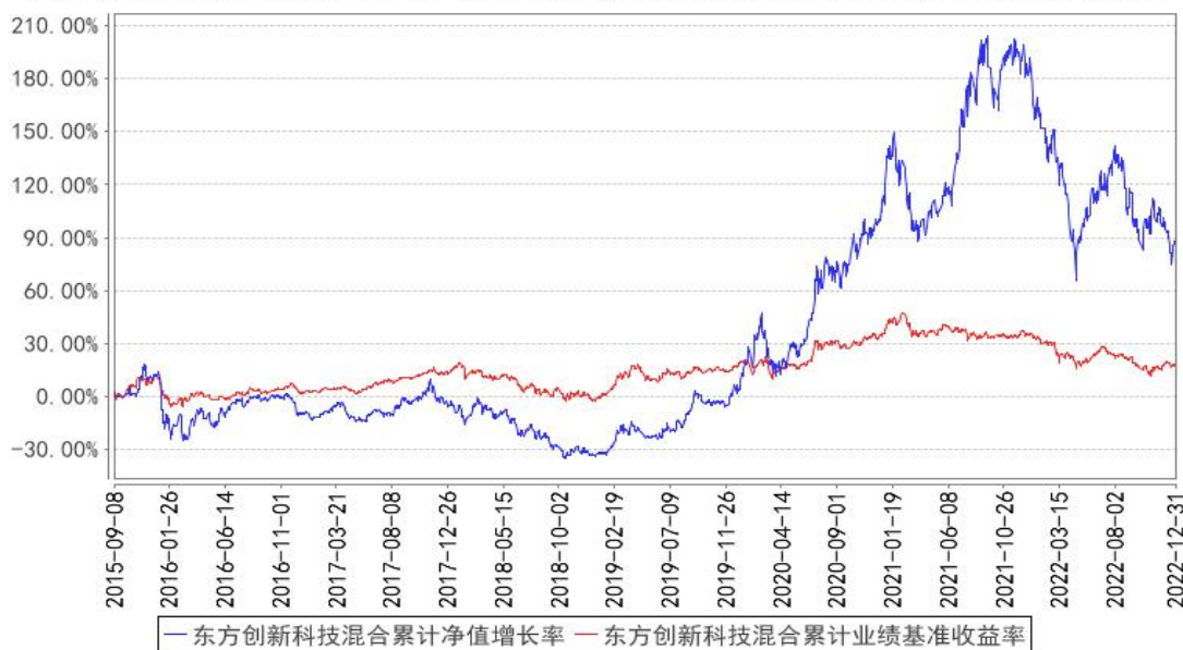
东方创新科技混合累计净值增长率与同期业绩比较基准收益率的历史走势对比图