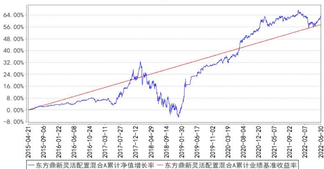
东方鼎新灵活配置混合A累计净值增长率与同期业绩比较基准收益率的历史走势对比图