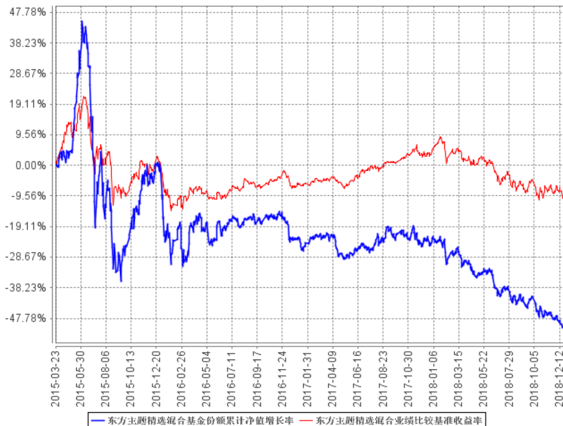
东方主题精选混合基金份额累计净值增长率与同期业绩比较基准收益率的历史走势对比图