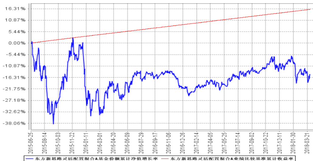
东方新思路灵活配置混合A基金份额累计净值增长率与同期业绩比较基准收益率的历史走势对比图

(二) 自基金合同生效以来基金累计净值增长率变动及其与同期业绩比较基准收益率变动的比较