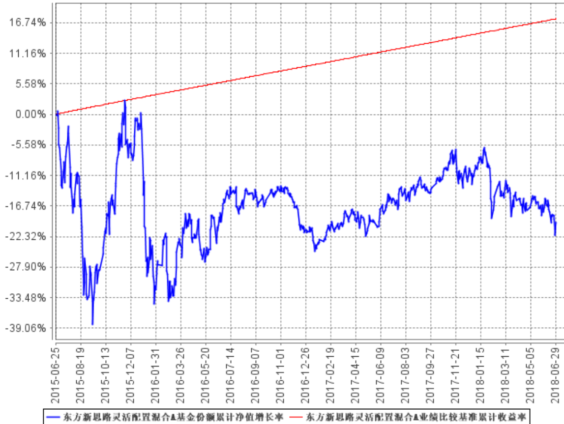
东方新思路灵活配置混合A基金份额累计净值增长率与同期业绩比较基准收益率的历史走势对比图