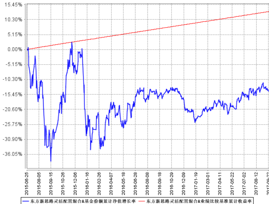
东方新思路灵活配置混合A基金份额累计净值增长率与同期业绩比较基准收益率的历史走势对比图