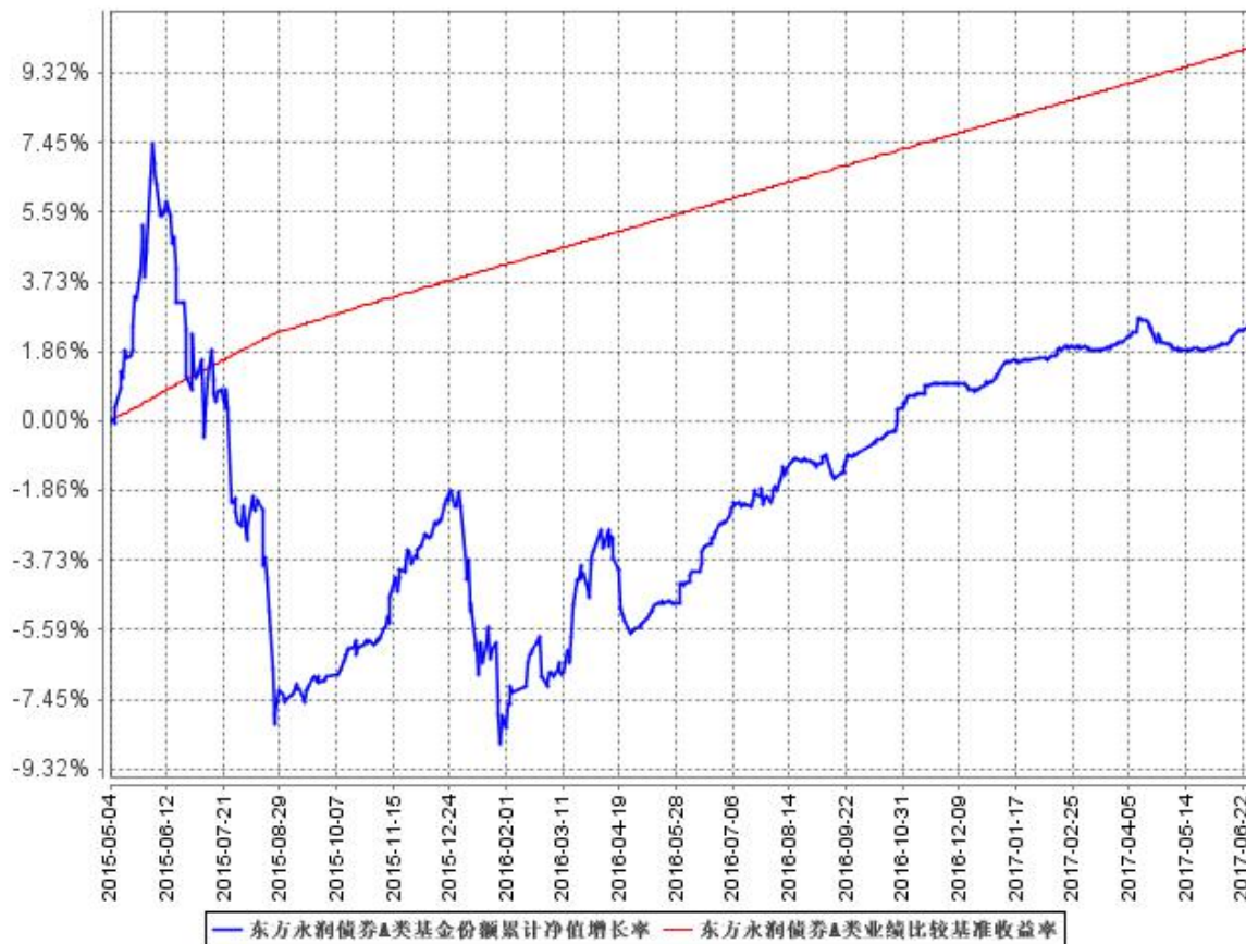
东方永润债券A类基金份额累计净值增长率与同期业绩比较基准收益率的历史走势对比图