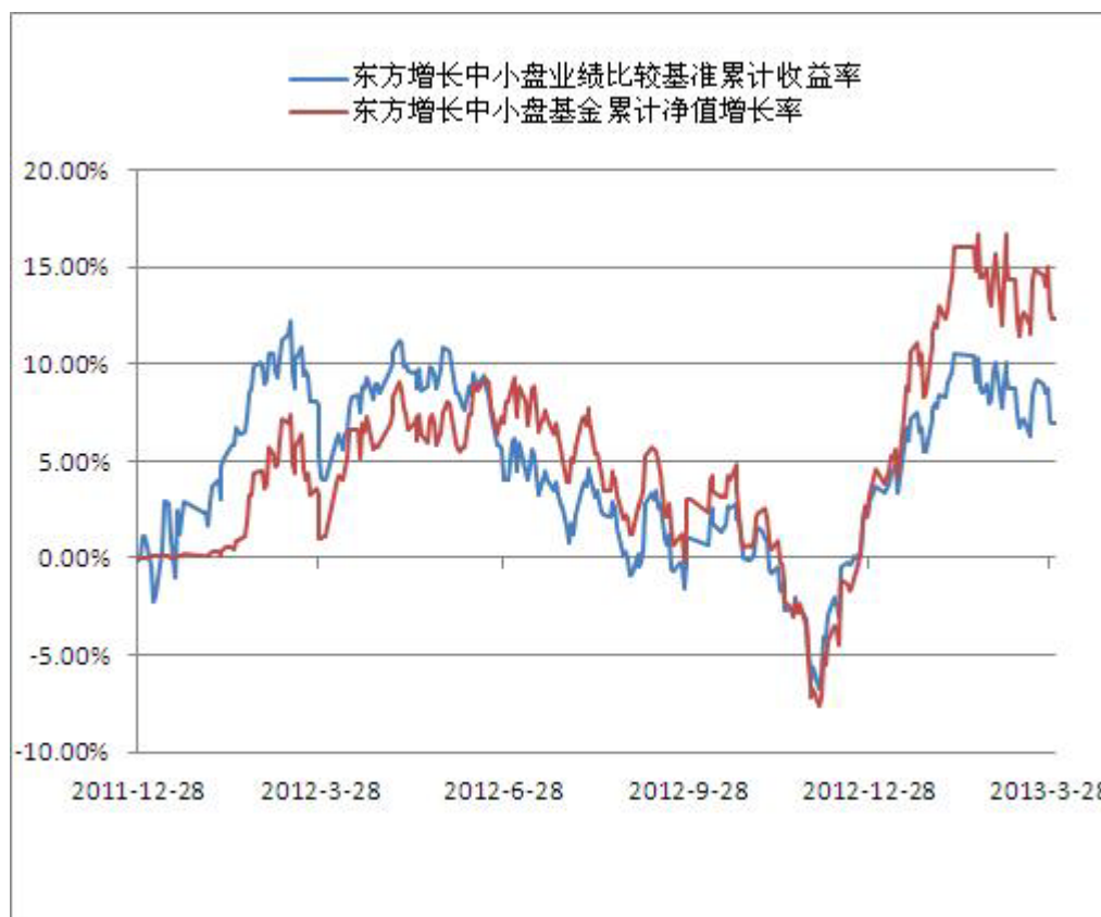
(二) 本基金累计净值增长率与业绩比较基准收益率的历史走势对比图

注：①根据《东方增长中小盘混合型开放式证券投资基金基金合同》的规定，本基金的投资组合比例为：股票资产占基金资产的比例为 30%-80%，其中投资于中小盘股的比例不低于本基金股票投资部分的 80%，投资于权证的比例不超过基金资产净值的 3%；债券资产、货币市场工具、资产支持证券以及法律法规或中国证监会允许基金投资的其他证券品种占基金资产的 20%-70%，其中，现金或到期日在一年以内的政府债券的投资比例不低于基金资产净值的 5%。基金的投资组合应在基金合同生效之日起 6 个月内达到规定的标准。