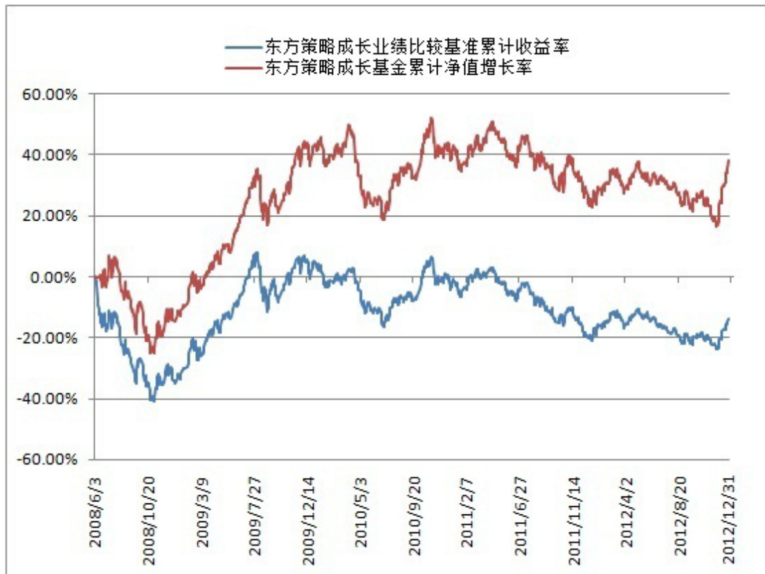
东方策略成长股票型开放式证券投资基金 份额累计净值增长率与业绩比较基准收益率历史走势对比图 (2008年6月3日至2012年12月31日)